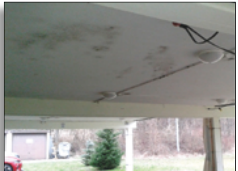
Terrasse mit Schimmel