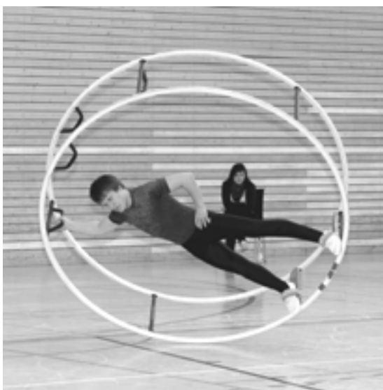
Johannes Keller in der Spirale

20.11.2010 – Deutsche Meisterschaften Einzel in Essen. Volle Konzentration war das Motto der Beiden und sie setzen es super um. Dieses Jahr war die Konkurrenz wieder sehr stark, da die Meisterschaften die Qualifikation für die WM-Qualis sind. Seit Juli gibt es keine Einschränkungen in der Schwierigkeitsnote mehr. Die acht schwierigsten Übungen gehen in den Schwierigkeitswert ein. Aufgrund dieser Änderung können nun deutlich schwierigere Übungen gezeigt werden. Dies zeigten einige der Konkurrenten auch und es wurde ein sehr hochklassiger Wettkampf.