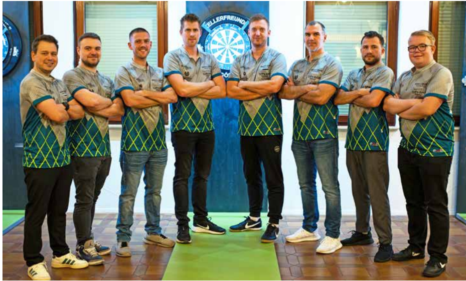
Kellerfreunde DJK Göppingen I – DVOS Bezirksliga A, Saison 2025/2026