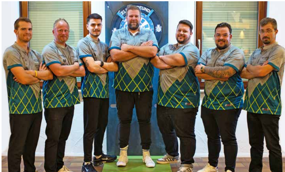
Kellerfreunde DJK Göppingen II – DVOS Kreisliga A, Saison 2025/2026